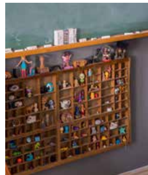
Sættetekassen er genial til dig, der bare elsker små dimser, figurer og nips. Du kan købe sættetekasser som denne på fx frou-frou.dk eller som ny på traeverar.dk.