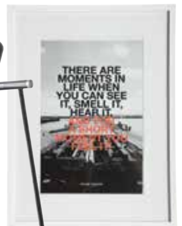
Billede i ramme, 'Moments in life', 30 x 40 cm, 100 kr., House Doctor.

Få en uhøjtidelig stemning i dit hjem med naturmaterialer, rustikke møbler og en skøn, varm belysning.