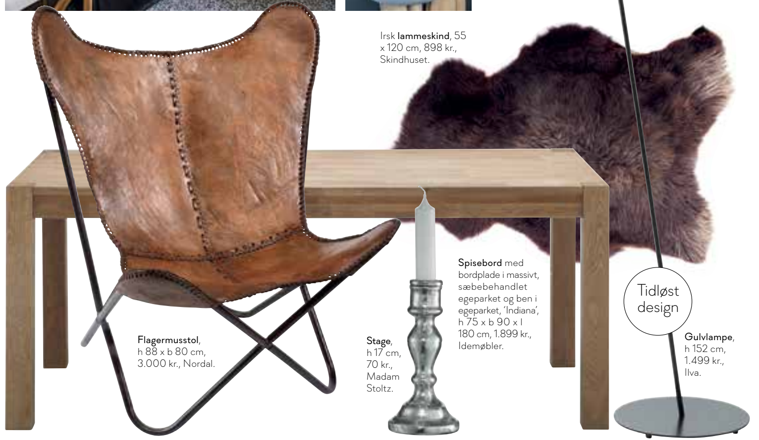
Irsk lammeskind, 55 x 120 cm, 898 kr., Skindhuset.