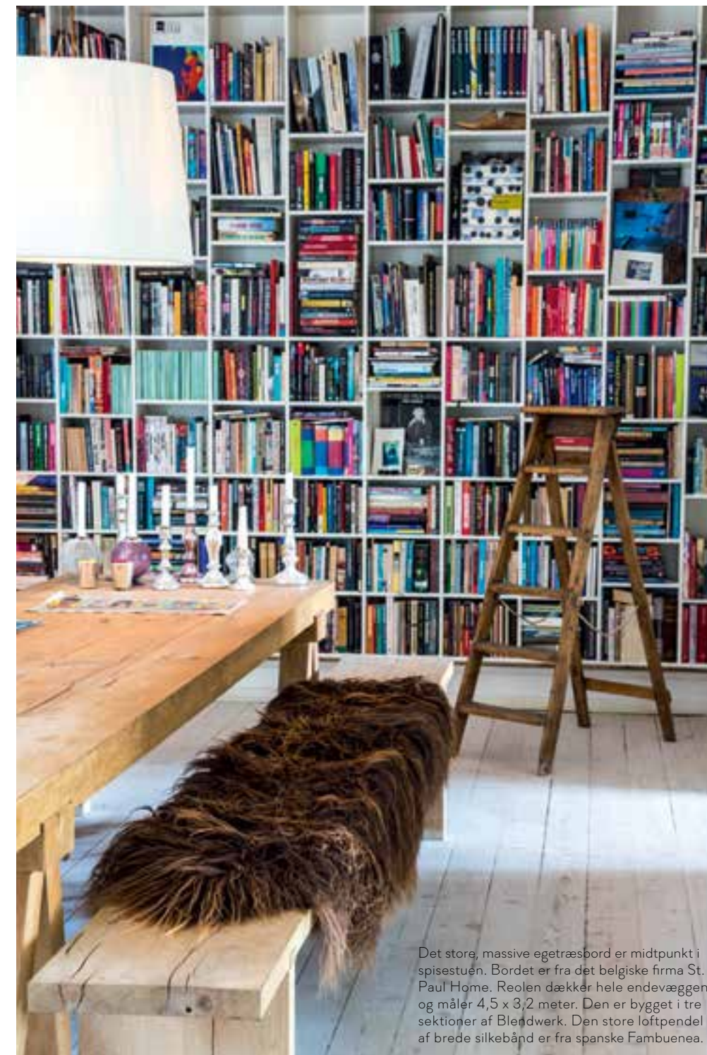
Det store, massive egetræsbord er midtpunkt i spisestuen. Bordet er fra det belgiske firma St. Paul Home. Reolen dækker hele endevæggen og måler 4,5 x 3,2 meter. Den er bygget i tre sektioner af Blendwerk. Den store loftpendel af brede silkebånd er fra spanske Fambuena.