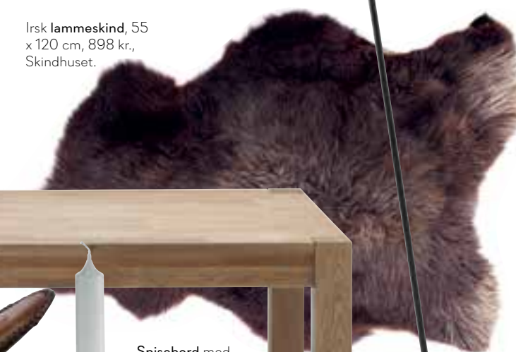
Irsk lammeskind, 55 x 120 cm, 898 kr., Skindhuset.