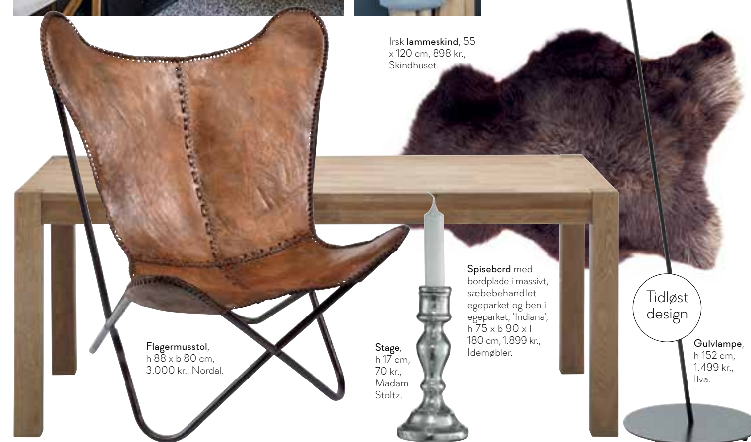
Flagermusstol, h 88 x b 80 cm, 3.000 kr., Nordal.