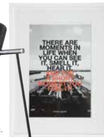
Billede i ramme, 'Moments in life', 30 x 40 cm, 100 kr., House Doctor.

Få en uhøjtidelig stemning i dit hjem med naturmaterialer, rustikke møbler og en skøn, varm belysning.